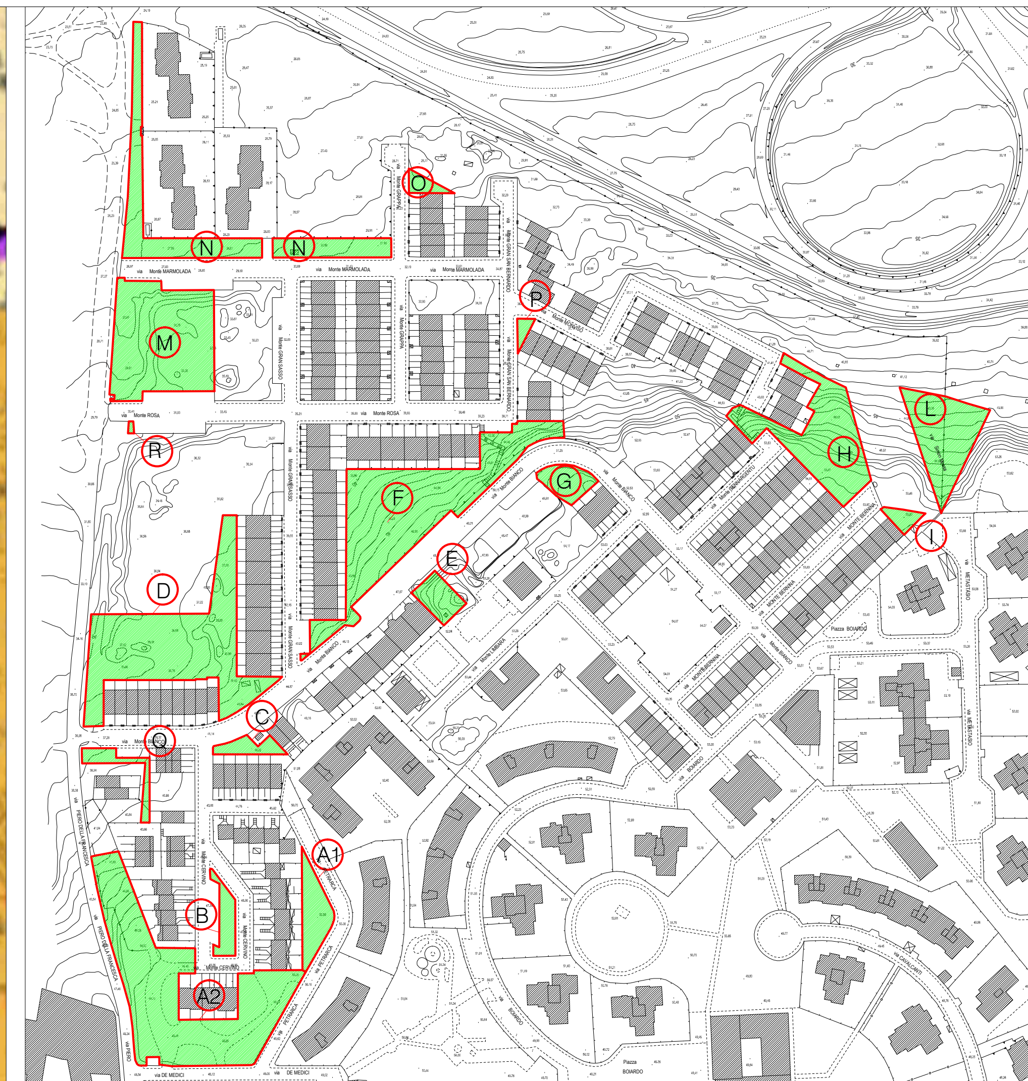
STRALCIO AEROFOTOGRAMMETRICO - SCALA 1:2000