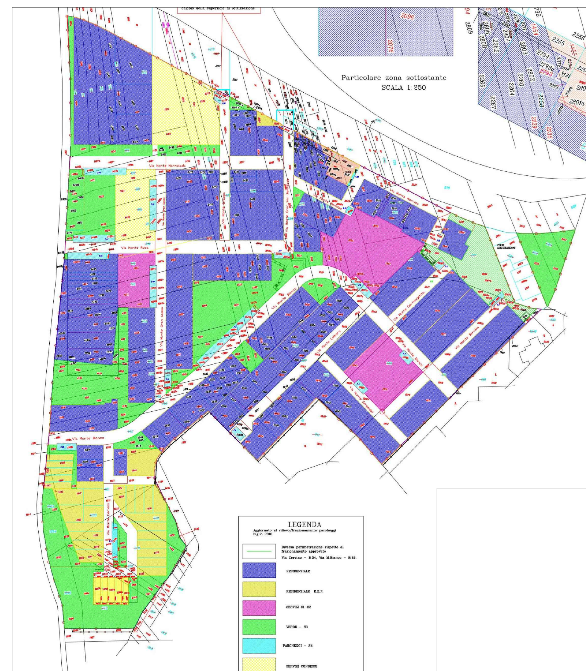
ZONIZZAZIONE - SCALA 1:2.000

■ C1 - Espansione con pianificazione attuativa