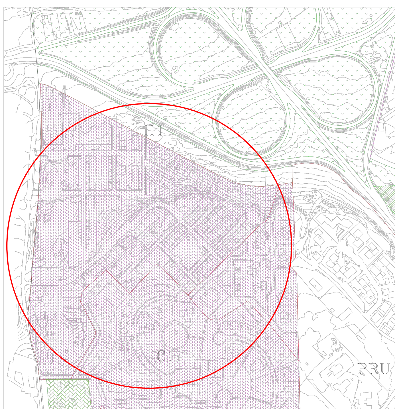
STRALCIO PIANO URBANISTICO COMUNALE - SCALA 1:4000 ZONIZZAZIONE DELL'ABITATO DI SU PLANU DA P.R.G.