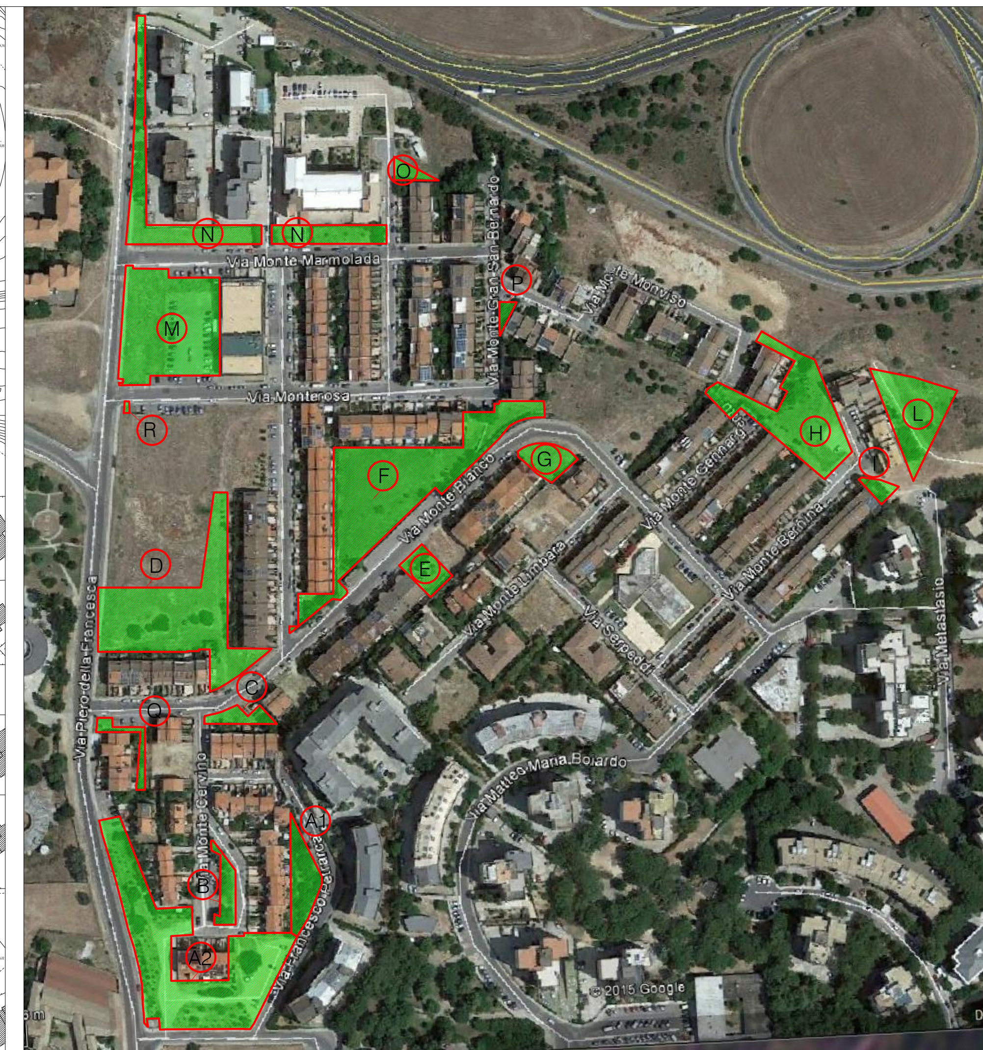
STRALCIO FOTO AEREA - SCALA 1:2000